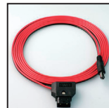
P-TAP 1000 D-TAPコネクタ用バッテリーケーブル