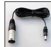
XLR 1000 XLR (4pin) 用バッテリーケーブル