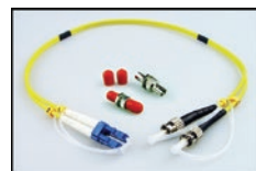
LC/ST Dup LC/STコネクタアダプターキット