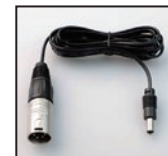
XLR 1000 XLR (4pin) 用バッテリーケーブル