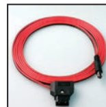
P-TAP 1000 D-TAPコネクタ用バッテリーケーブル